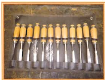
Ciseaux à bois de différentes formes et grandeurs