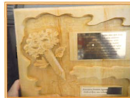
Fleurs, oiseau, arbres... modèles