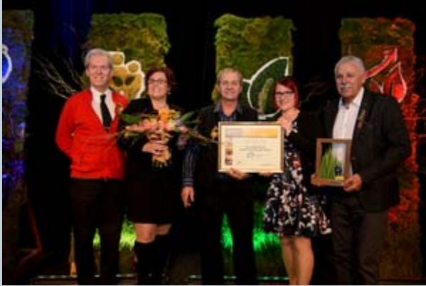
La Municipalité de Saint-François-de-Sales Catégorie 5 000 habitants et moins

Les deux gagnants du prix parrainé par la FSHEQ Reconnaissance en mobilisation citoyenne sont :