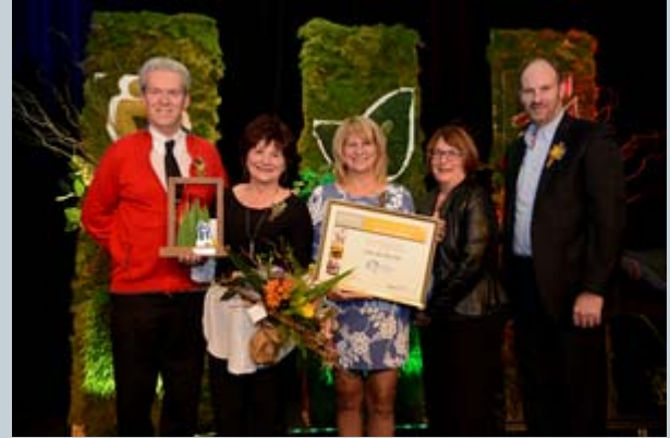
La Ville de Val-d'Or Catégorie de 5 000 habitants et plus