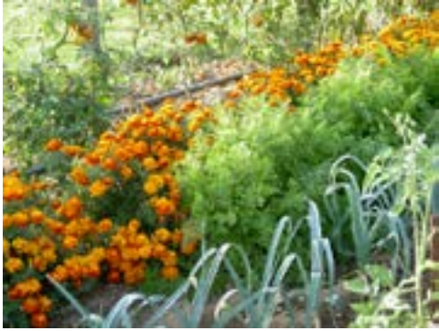
Exemple d'association végétale bénéfique : les oeillets d'Inde protègent les carottes des attaques parasitaires.