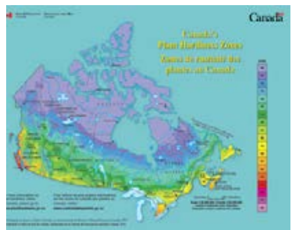
Cliquer sur l'image pour télécharger la carte en PDF.

La meilleure façon de connaître la rusticité d'une plante, c'est encore de l'expérimenter dans son jardin.